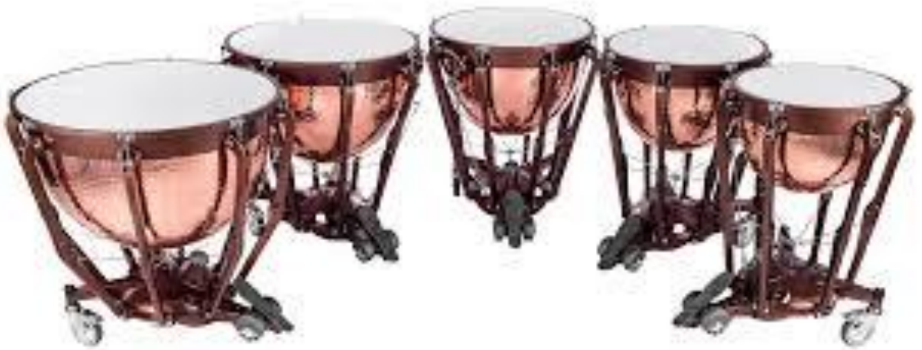
↑ Τύπανα Timpani