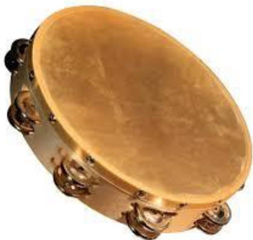
← Ντέφι Tambourine