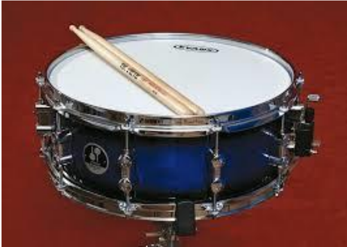
Ταμπούρο Snare Drum