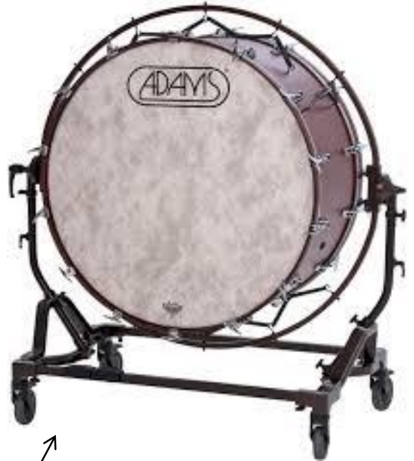
Κάσσα Bass Drum